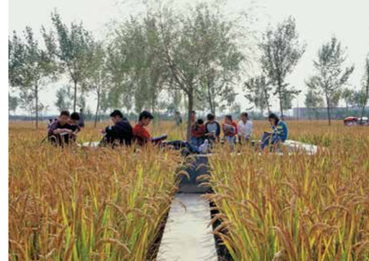
'Frame and access' – sti og bæk i den oversvømmede Red Ribbon park. 'Frame and access' – path and bench in the flooded Red Ribbon park.