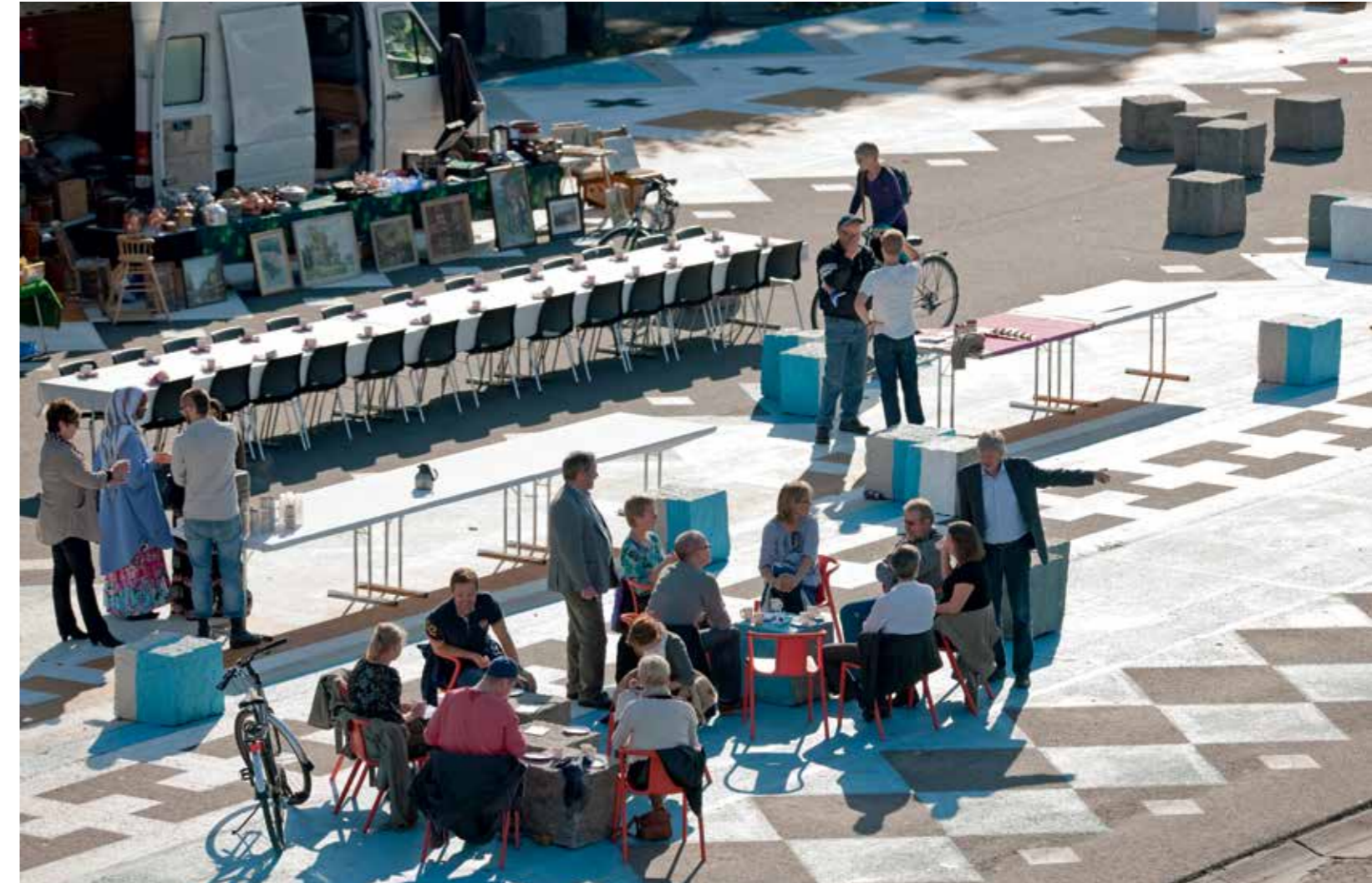
Midlertidigt gulv og langbord på byens torv, DreamHamar. Temporary floor and long table on the city square, DreamHamar.