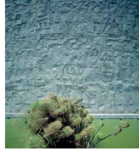
Snøhetta. Relief og papir – stenfacade og papyrus ved biblioteket i Alexandria. Snøhetta. Relief and paper – stone facade and papyrus at the library in Alexandria.

Set i det perspektiv stillede 'Nordic Encounters' også spørgsmål ved, hvor meget det regionale betyder versus det globale? Måske er det slet ikke så vigtigt, hvor landskabsarkitekter 'kommer fra', som hvordan vi agerer i forhold til sted og projekt – hvilke metoder