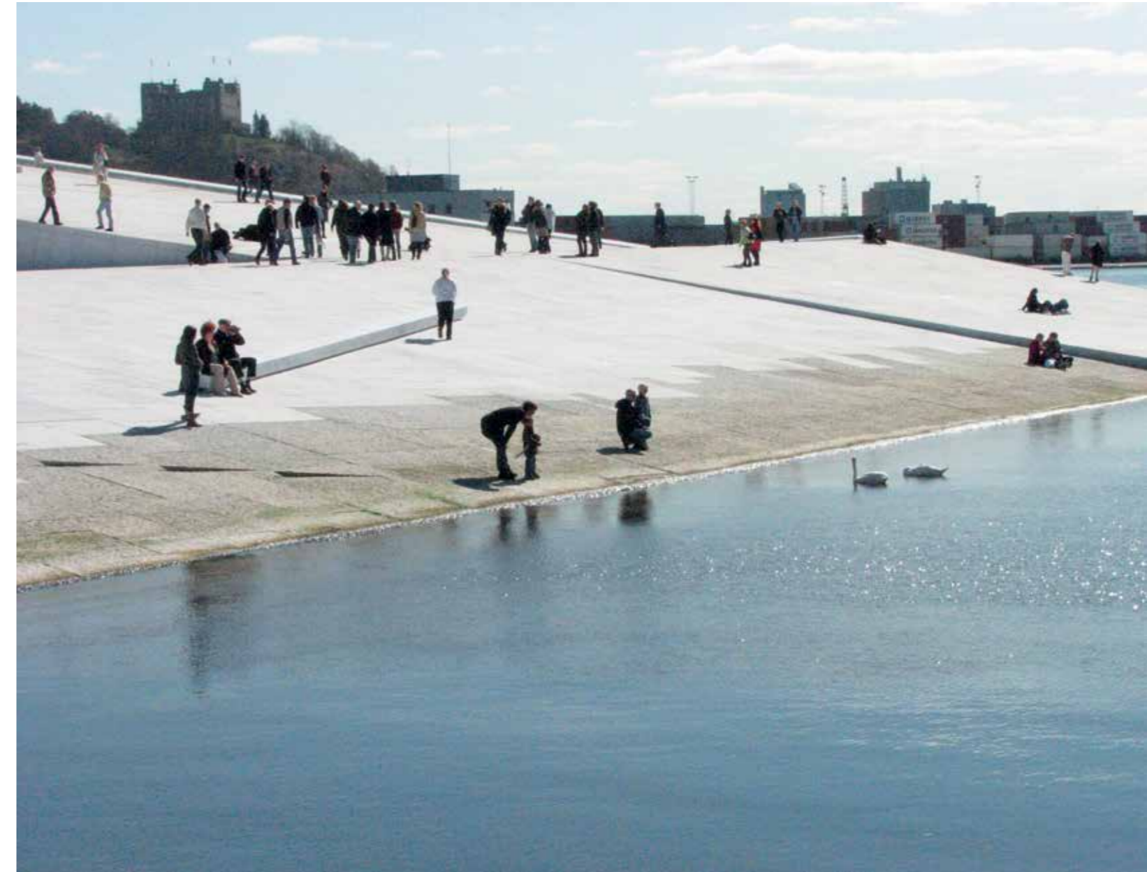
Snøhetta. Stenen, vandet og byen – Operaen i Oslo. Foto Snøhetta Snøhetta. Snøhetta. Stone, water and the city – the Opera in Oslo. Photo Snøhetta

hver især tager i brug for at lave stedsspecifikke projekter. Her var der en fin pointe i Snøhettas sammenligning af tegnestuens to kontorer i henholdsvis Oslo og New York, som ligger fuldstændig ens placeret i forhold til byrelation og til vand og havn.