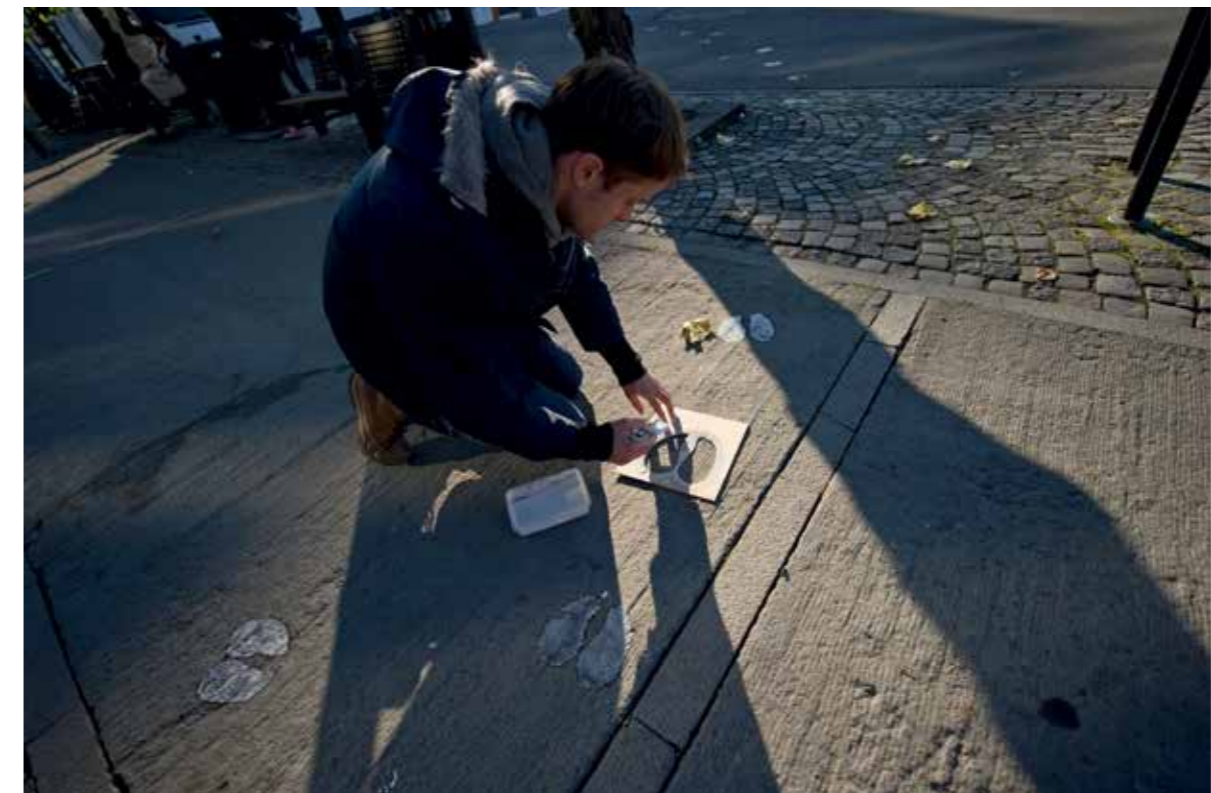
Feet-on-brugerinddragelse, DreamHamar. Feet-on-user participation, DreamHamar.