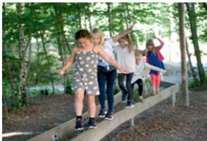
Skovloopet er tegnet af Vega Landskab. Ifølge skolen selv har det også lokket flere af pigerne ud af klasselokalerne.

RK Jeg synes, nøglen ligger i at sikre tilgængelighed for alle og ikke ekskludere minoriteter. Jeg ville dog være lidt bekymret for at sætte et specifikt kønsparameter op. For nogle mennesker er dørtrinnet den største barriere for at komme ud og mødes med andre. Derfor er version 3.0 af moderne byplanlægning en integration af aktivitetsmuligheder direkte i planlægningen, hvor det er nemt og oplagt at bevæge sig i det offentlige rum. Her er København et skoleeksempel, f.eks. havnebadet, det at du kan svømme direkte uden for din bolig. Eller alle de mange motionsløb, der er i byens gader, det er jo fantastisk. Vi skal ikke mange år tilbage tiden, før man blev set på med undren, hvis man gjorde den slags. Endelig er cykelbroerne i hovedstaden et scoop, nærmest et symbol på bevægelse for byen.