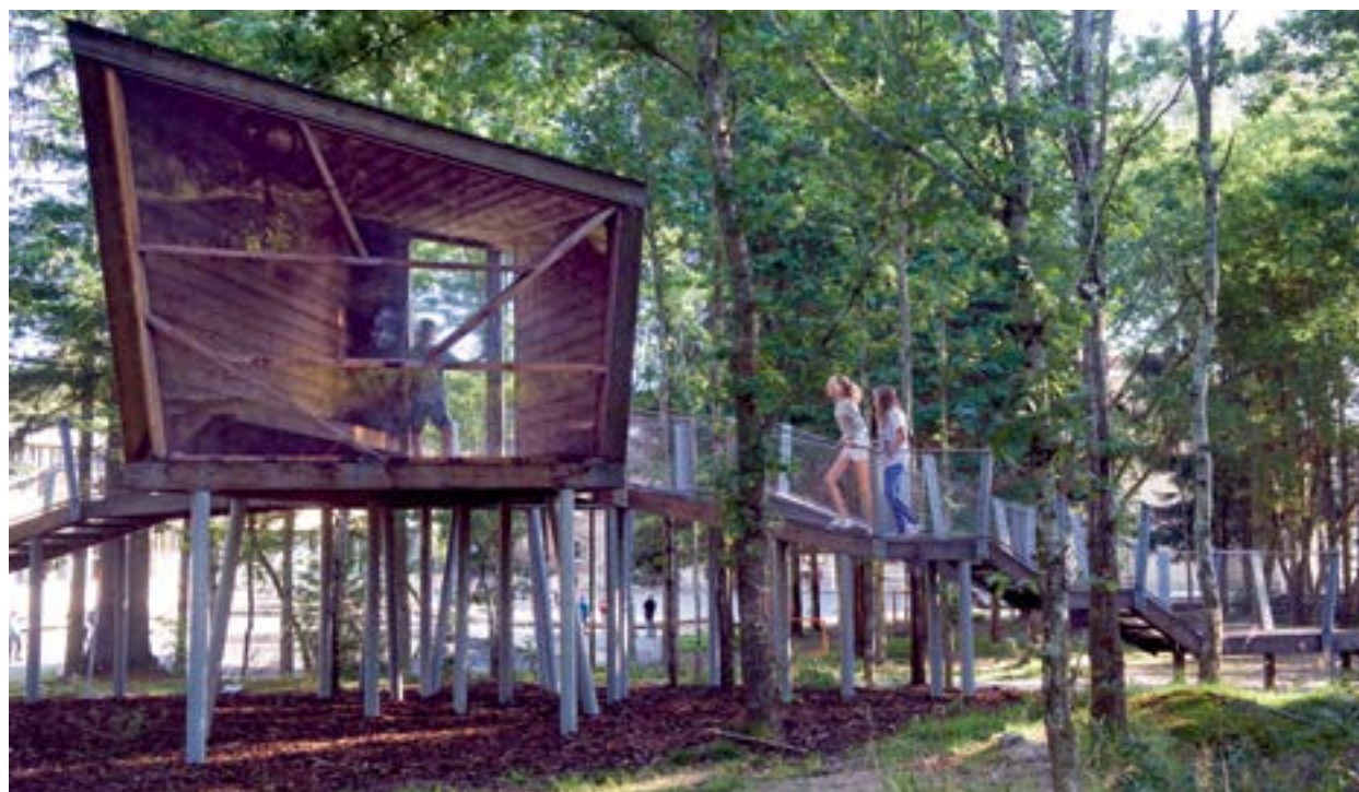
Et eksempel på et af de mere afgrænsede rum, som mange piger efterspørger.