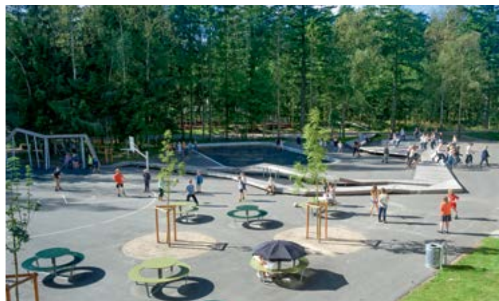
Lokale- og Anlægsfonden har fokus på pigers aktivitet i det offentlige rum. Fonden har bl.a. støttet udviklingen af skolegården til Skørping Skole, hvor et skovloop udnytter den tilstødende skov bedre og tilbyder et mere varieret bevægelsesrum.