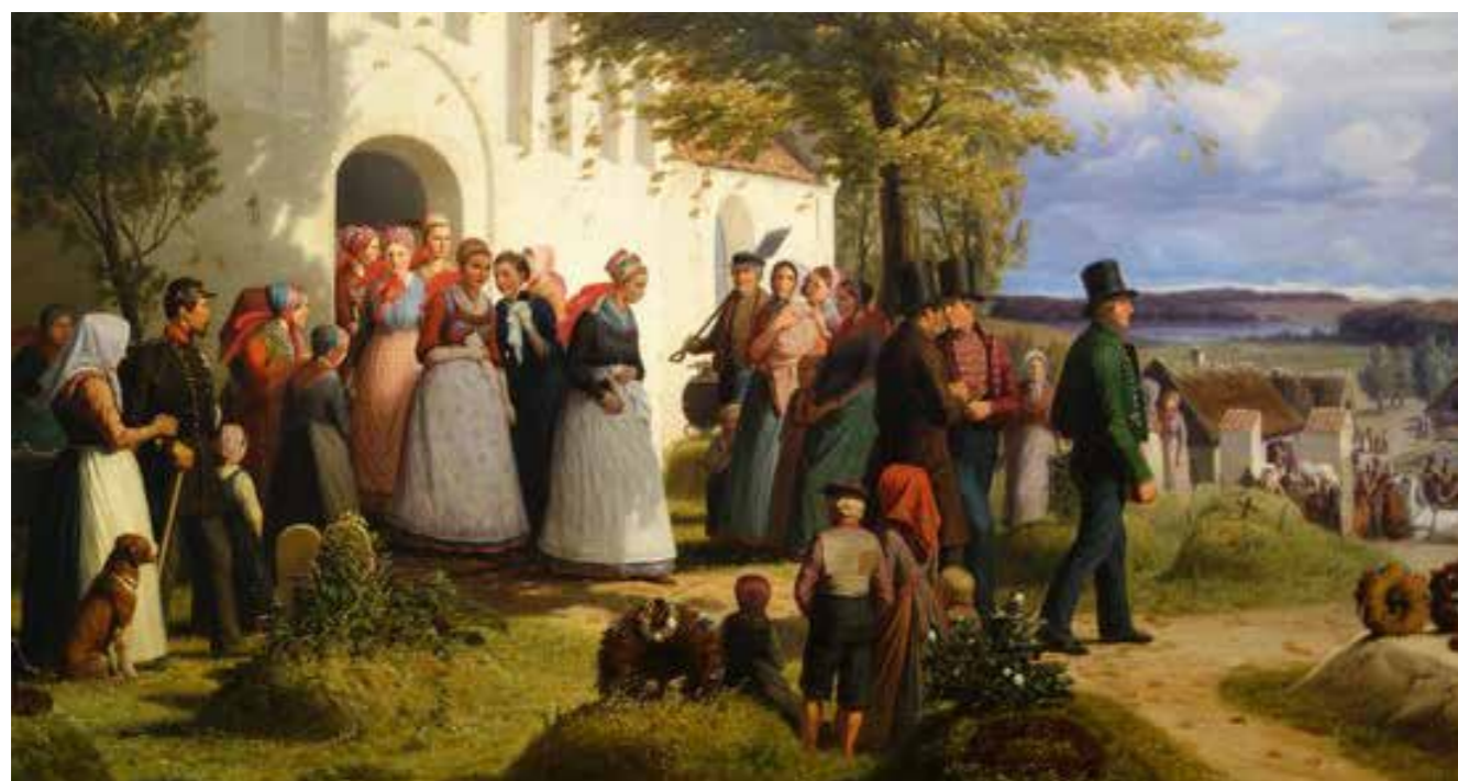
Kirkegården før år 1800: Træer, græs og tue-grave dominerede datidens kirkegårde, der også blev brugt som festligt samlingssted for sognets beboere. J. Sonne: Da soldaten kom hjem. Ca. 1840, foto fra aros.dk

Tekst og illustration: Anne Galmar, ag@vegalandskab.dk og Anne Dorthe Vestergaard, adv@vegalandskab.dk VEGA landskab